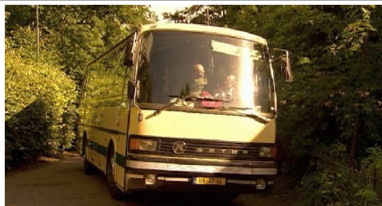
Der Schulbus holt Bonnie zum Ausflug ab...

Hier kannst du gut sehen, wie der Regisseur die Sequenz zusammengestellt hat: