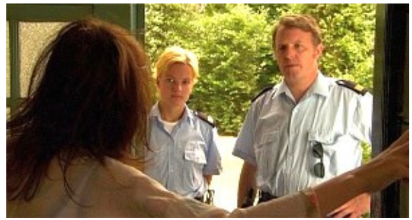
Warum ist Bonnies Mutter größer im Bild?

Beschreibe, welchen Blickwinkel die Kamera bei diesen Bildern einnimmt: