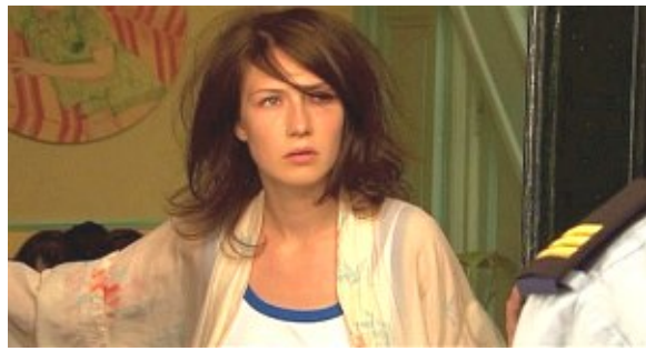
Siehst du die Schulter der Polizistin?

Hier siehst du noch einmal einen Gegenschnitt – die Bilder sind so aufgenommen, dass du als Zuschauer einer Person über die Schulter schaust. Dadurch wirst du in die Geschichte stärker hineingezogen und fühlst besser mit den Personen mit.